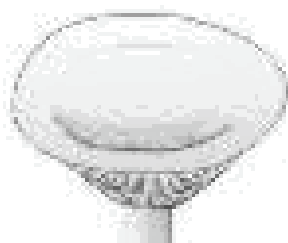
infundibuliforme (a imbuto)