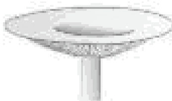
concavo o depresso