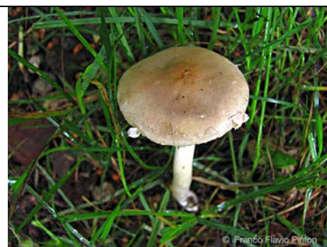
AGROCYBE PRAECOX 2