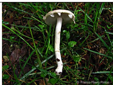
AGROCYBE PRAECOX 3