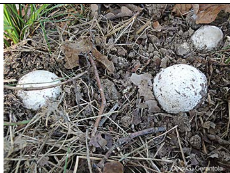
OVULO AMANITA CAESAREA

RILIEVI EFFETTUATI SU REPERTI FRESCHI SECCHI