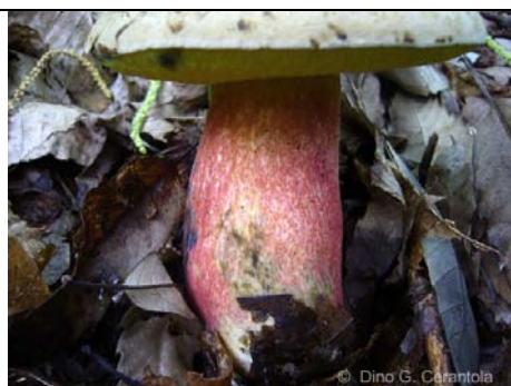
BOLETUS CALOPUS 04