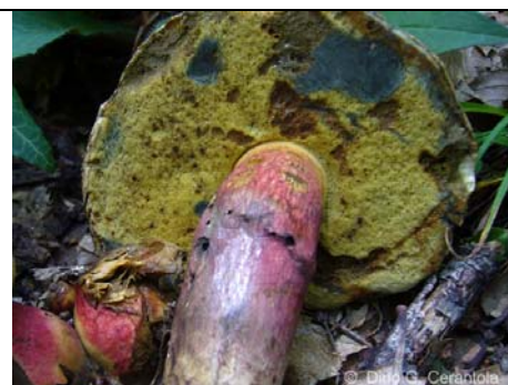
BOLETUS CALOPUS 06