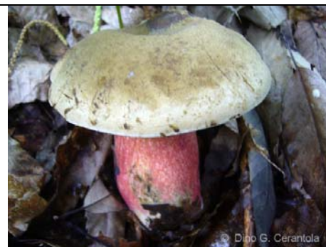
BOLETUS CALOPUS 03