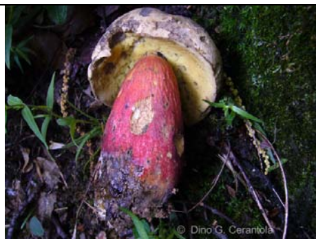
BOLETUS CALOPUS 01

RILIEVI EFFETTUATI SU REPERTI FRESCHI SECCHI