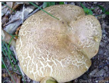
BOLETUS CALOPUS 02