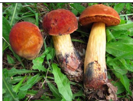
BOLETUS QUELETHII V. RUBICUNDUS_

RILIEVI EFFETTUATI SU REPERTI FRESCHI SECCHI