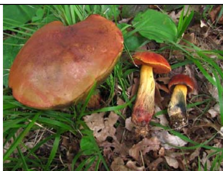
BOLETUS QUELETHII V. RUBICUNDUS_2