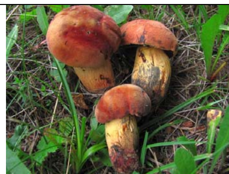
BOLETUS QUELETHII V. RUBICUNDUS_3