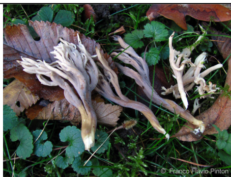
CLAVULINA CINEREA 2