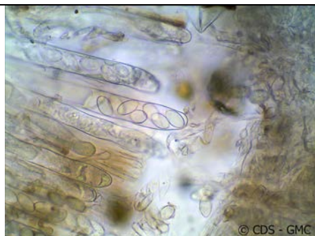
ASCO CON SPORE