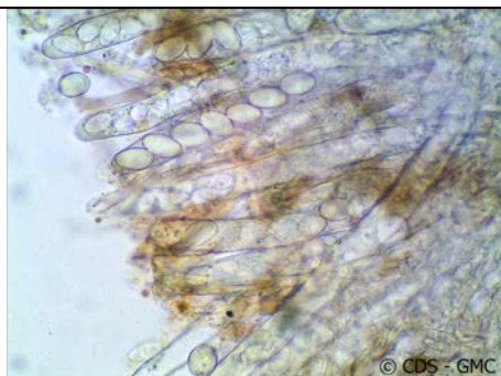
ASCO CON SPORE