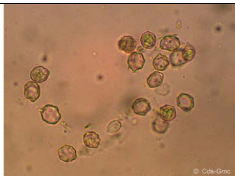
SPORE X 400