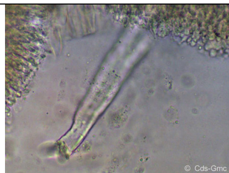
CISTIDIO FLAMMULINA VELUTIPES1