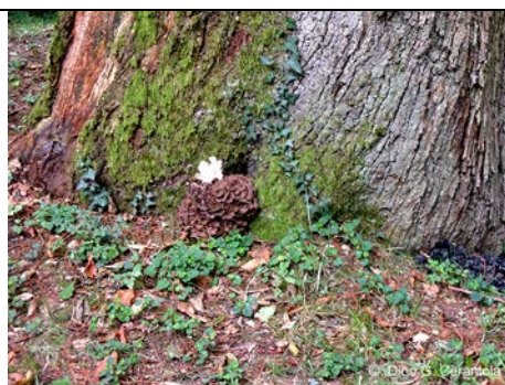
HABITAT GRIFOLA FRONDOSA

RILIEVI EFFETTUATI SU REPERTI FRESCHI SECCHI