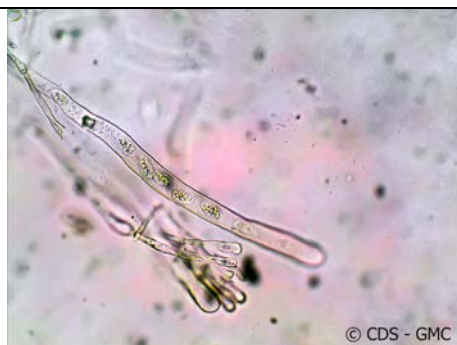
ASCO CON SPORE