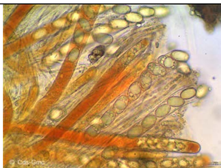
ASCHI- SPORE E PARAFISI