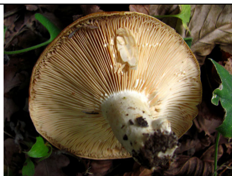
LACTARIUS EVOSMUS 2