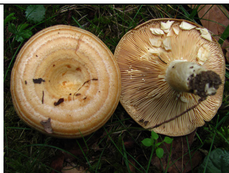
LACTARIUS EVOSMUS 1

RILIEVI EFFETTUATI SU REPERTI FRESCHI SECCHI