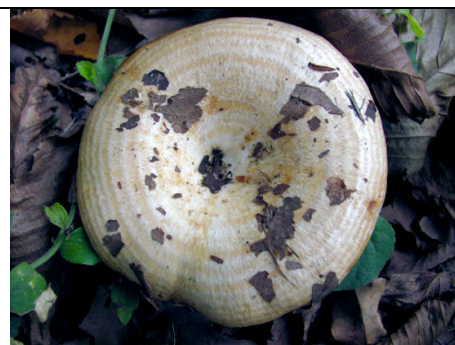
LACTARIUS EVOSMUS 3