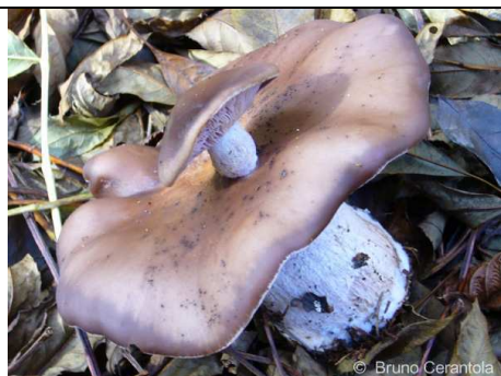
LEPISTA NUDA 4