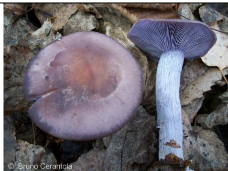
LEPISTA NUDA 1

RILIEVI EFFETTUATI SU REPERTI FRESCHI SECCHI