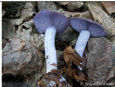
LEPISTA NUDA 2