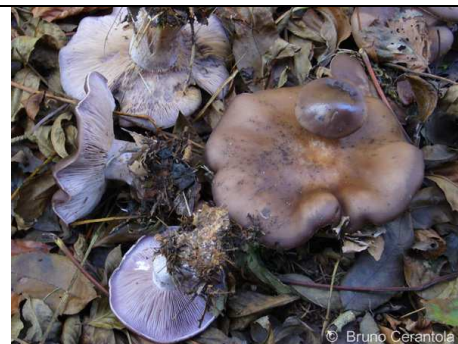
LEPISTA NUDA 3