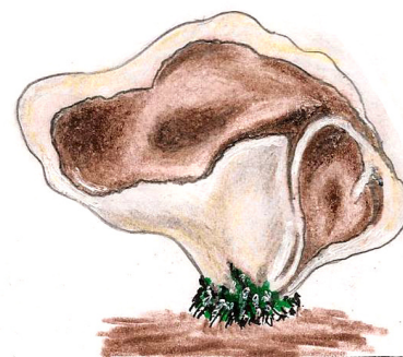
PEZIZA AMPELINA 3