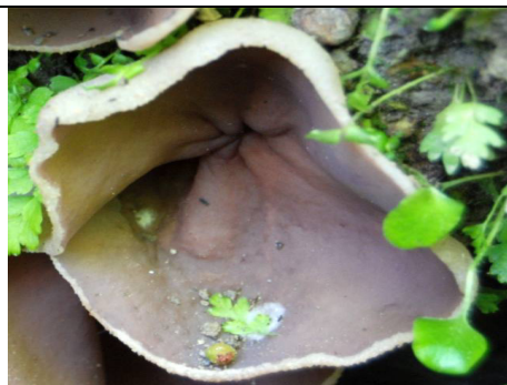
PEZIZA AMPELINA 1