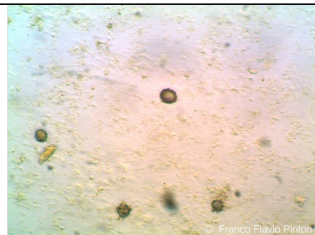
SPORA RUSSULA CHLOROIDES