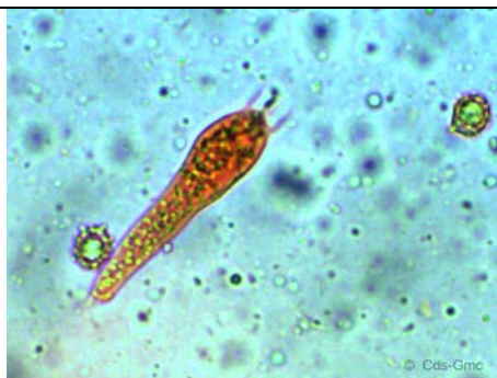
BASIDIO TETRASPORICO X 400