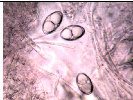
SPORE BIGUTTULATE PARAFISI CILINDRACEE