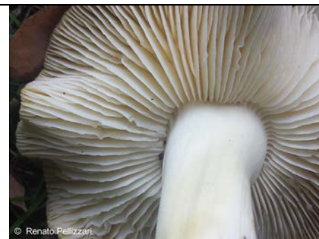
TRICHOLOMA SEJUNCTUM 1