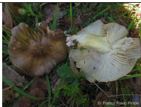
TRICHOLOMA SEJUNCTUM 3