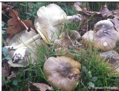
TRICHOLOMA SEJUNCTUM 2