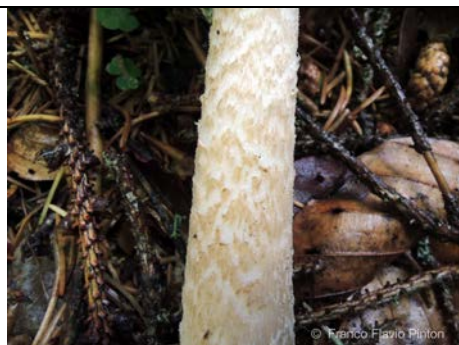
AMANITA BATTARRAE GAMBO