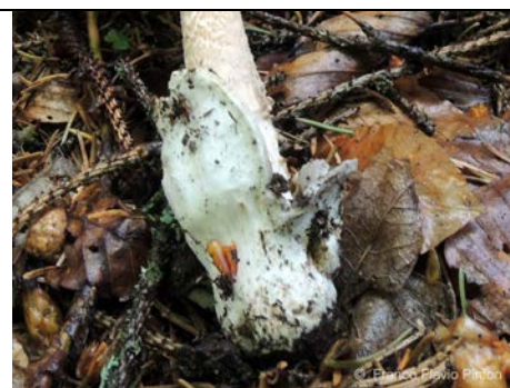
AMANITA BATTARRAE VOLVA