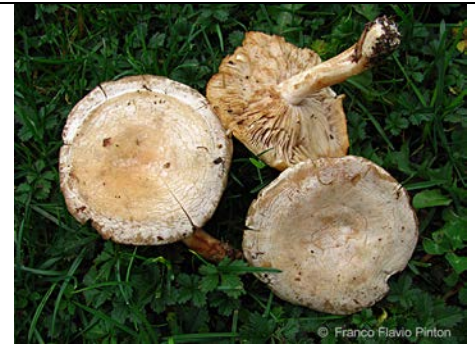
CLITOCELLA FALLAX 3