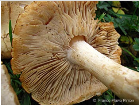
CLITOCELLA FALLAX 1

RILIEVI EFFETTUATI SU REPERTI FRESCHI SECCHI