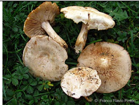
CLITOCELLA FALLAX 2