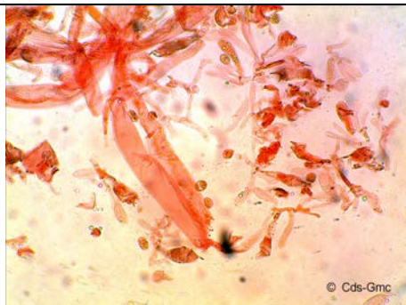
CHEILOCISTITIDI E SPORE