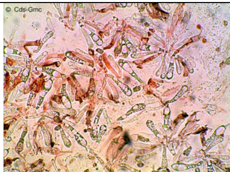
BASIDI E BASIDIOLI