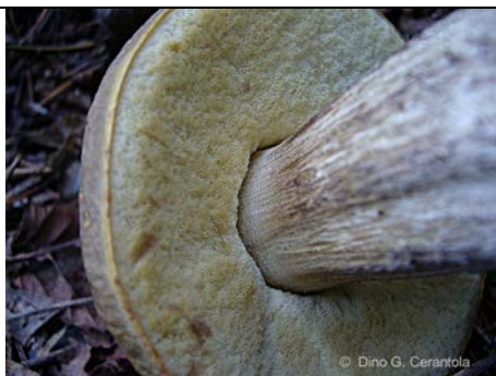
LECCINUM PSEUDOS CABRUM