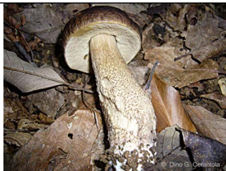
LECCINUM PSEUDOS CABRUM

RILIEVI EFFETTUATI SU REPERTI FRESCHI SECCHI