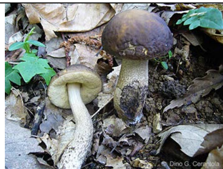
LECCINUM PSEUDOS CABRUM