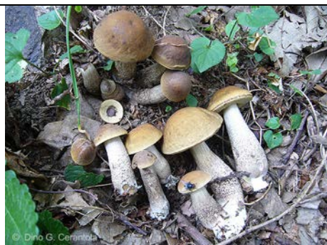
LECCINUM PSEUDOS CABRUM