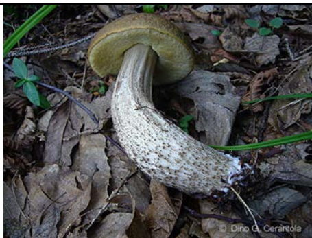
LECCINUM PSEUDOS CABRUM