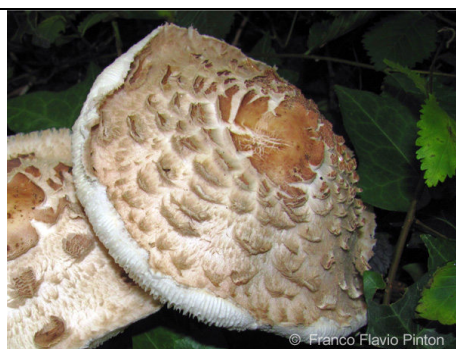
CAPPELLO CON SQUAME