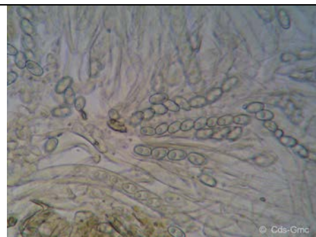
ASCHI CON SPORE