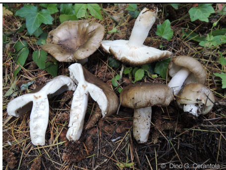
RUSSULA SORORIA 1